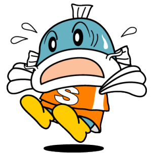
滋賀県イメージキャラクター「キャッピー」