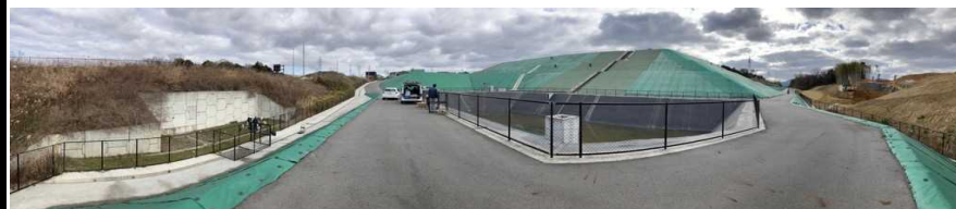
写真② 調整池付近の様子