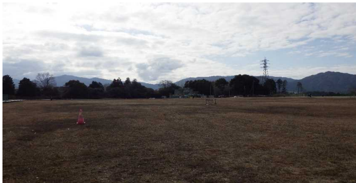
写真① 天端部の様子