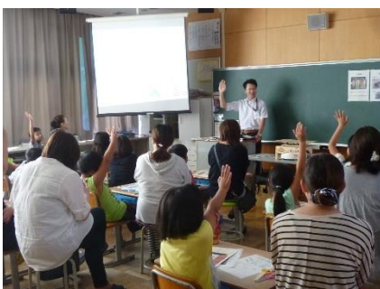
小学校での出前講座