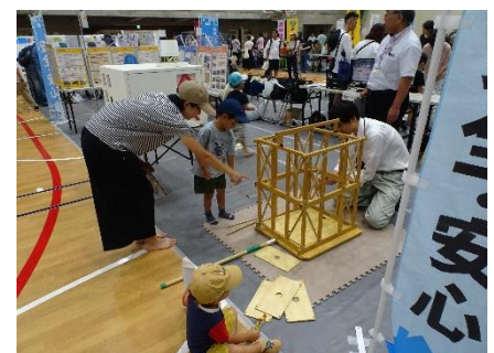
啓発イベントにおけるブース出展