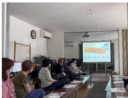
自治会での出前講座