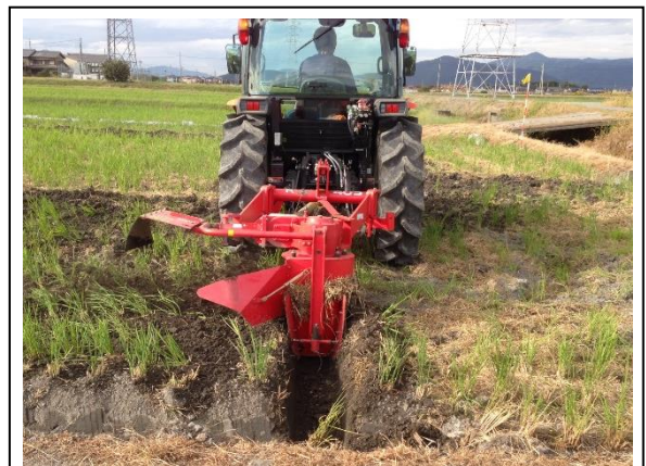
オーガ式溝掘機等で しっかりした排水溝を作る

稲刈りが終わったほ場から順次溝掘りを行いましょ。播種時期を見据え、乾くタイミングを逃さず排水溝を設置し、スムーズに播種が行えるよう準備を進めましょ。10月上旬までを目途に作業を行います。