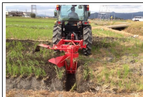
オーガ式溝掘機等で しっかりした排水溝を作る

特に本年は、曇雨天が続いた影響で水稲の収穫時期 が例年よりも遅くなっており、麦の播種時期まで十分 な時間が取れない恐れがあります。稲刈りが終わったほ場は、乾くタイミングを 逃さずすぐに排水溝を設置し、スムーズに播種が行えるよう準備を進めましょ う。