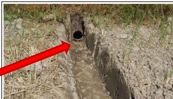
排水溝は尻水戸にしっかりつなぐ！ (溝の深さは15cm以上)