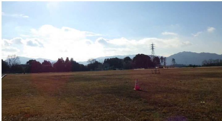
写真① 天端部の様子