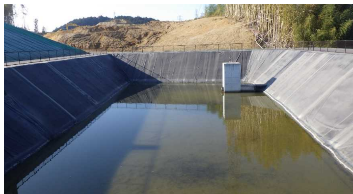
写真② 調整池付近の様子