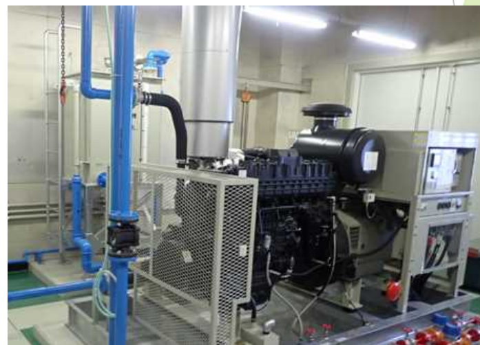
自家発電設備更新工事（中継ポンプ場）