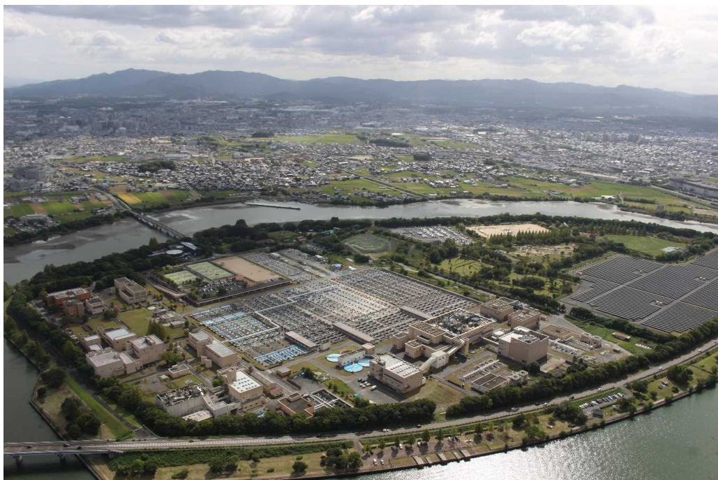
湖南中部浄化センター（草津市）