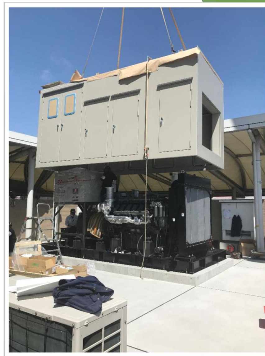
びわこボートレース場の自家発電設備