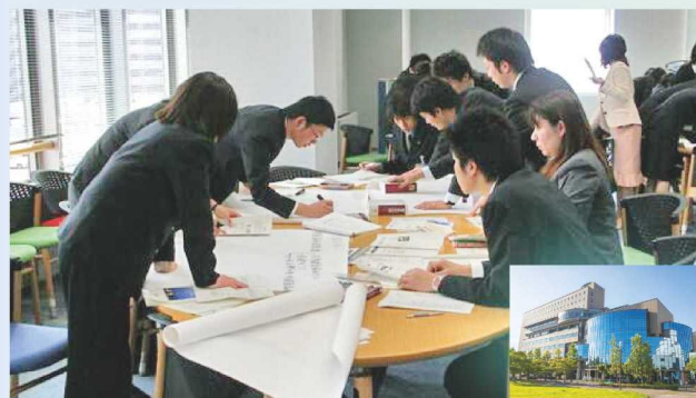
政策研修センター(大津市 ピアザ淡海内)

本県では「人こそが最大の経営資源である」との認識のもと、人材育成に力を入れています。採用後は新規採用職員研修や職場でのOJTを通じて、基礎知識を身につけながら安心して業務に取り組める環境が整っています。