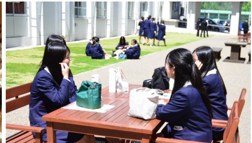
プライベート 休息