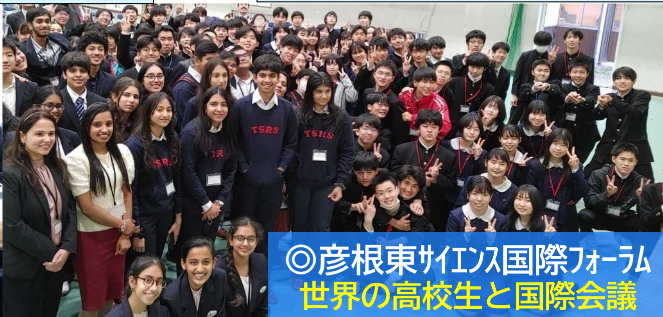
◎彦根東サイエンス国際フォーラム 世界の高校生と国際会議