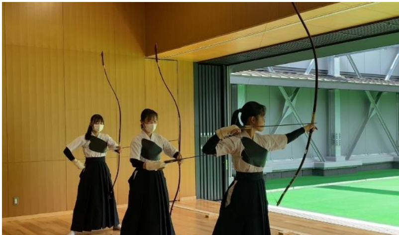
部活動おもいきり

高校での 授業・行事・部活動 等の教育活動に 加えて 、大学での特別聴講 <先取り履修>を行うために、各生徒は 週末などの時間を有効活用 している。