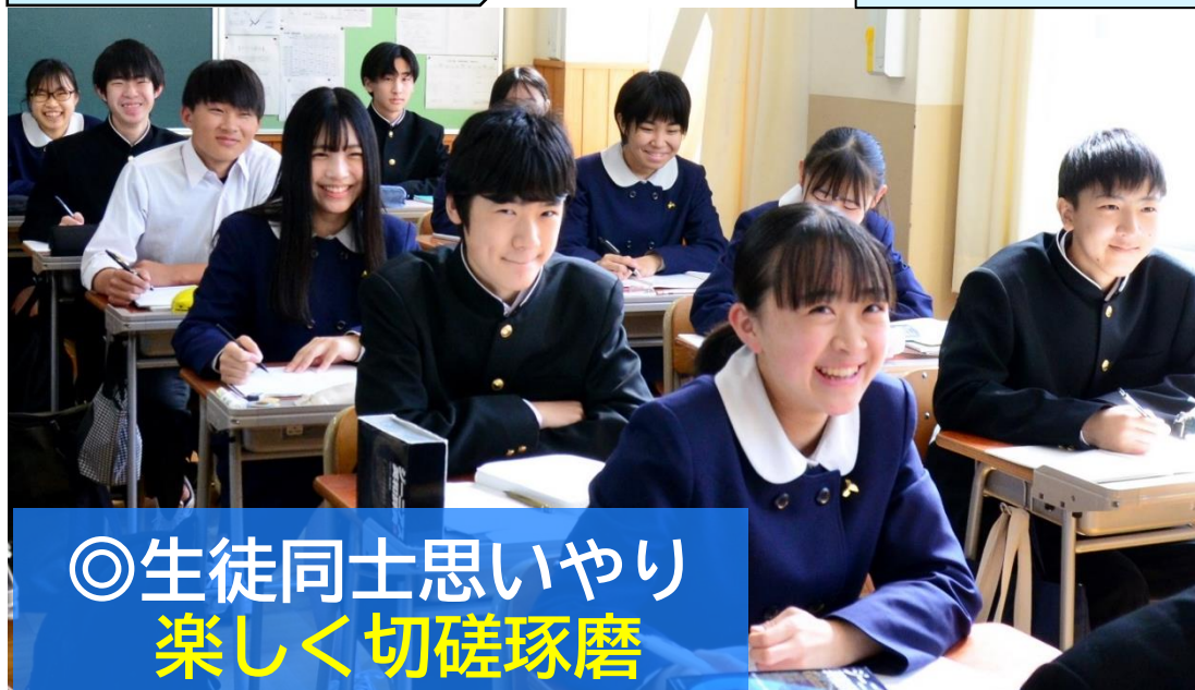
◎生徒同士思いやり 楽しく切磋琢磨