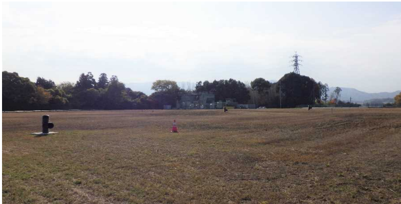
写真① 天端部の様子