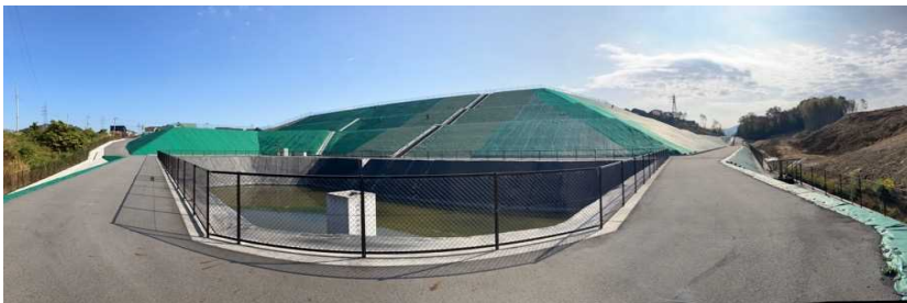
写真② 調整池付近の様子