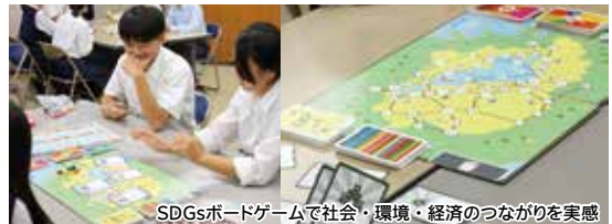
SDGsボードゲームで社会・環境・経済のつながりを実感

北部地域の高校生が、地域の課題解決について学び話し合う「北の近江振興高校生サミット 集え！北の高校生たちよ！」が今年度から始まりました。7月にはキックオフミーティングが開催され、北部の各高校の代表が集結。現在、2月のサミット本番に向けて活発な課題研究活動が行われています。