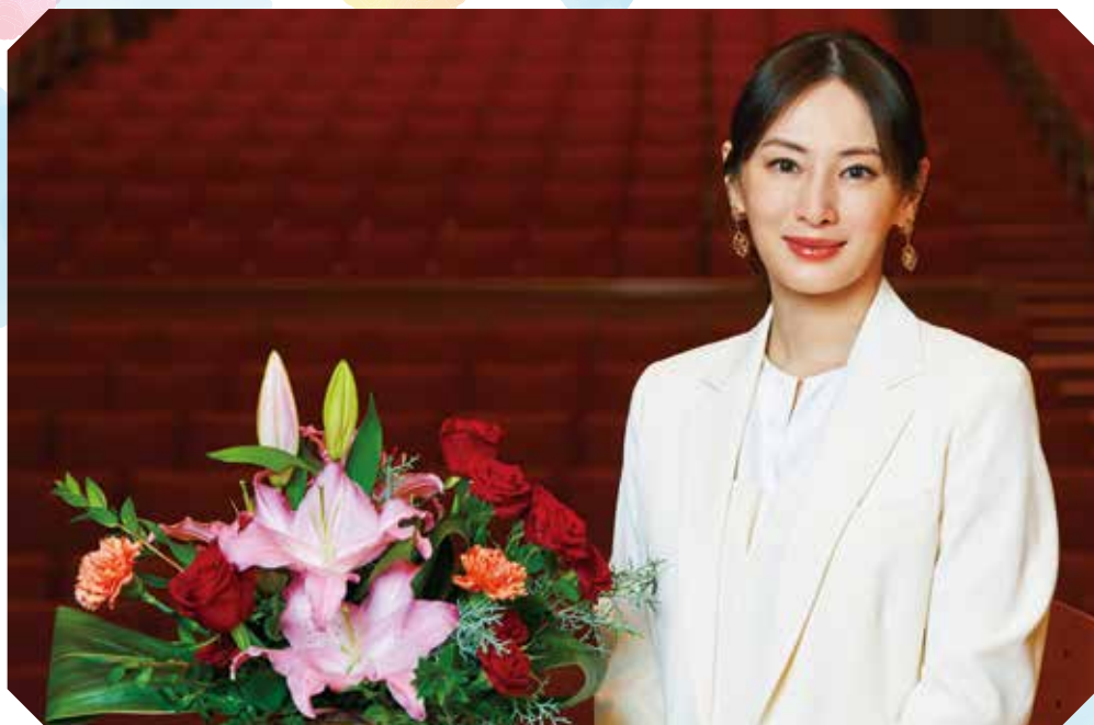
2023年11月11日に開かれたトークショー会場にて(長浜市浅井文化ホール)

1986年生まれ。2023年10月には、デビュー20周年を記念する写真集を7年ぶりに発売。大河ドラマ「どうする家康」(NHK)(2023年)など、数多くの映画やドラマで活躍中。