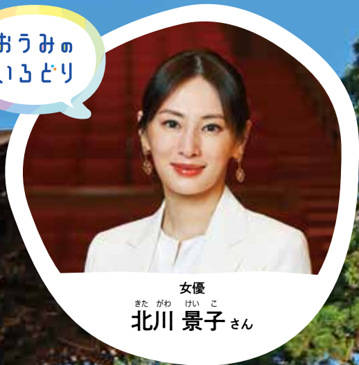
女優 きたがわ けいこ 北川 景子 さん