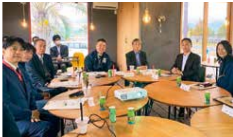
米原市にて、企業の皆さんと意見交換を行いました!

し、たくさんの可能性を見つけました。 いよいよ3月に北陸新幹線「敦賀駅」 が開業します。「湖北」や琵琶湖の観光 を盛り上げるチャンスです。東海道新 幹線「米原駅」は滋賀県の玄関口。駅前 を盛り上げ、より便利に。まだまだや れることがあります! 北部地域の高校をもっと魅力的にし よう! 「働くところ」も大事なので、企 業の投資や産業の立地も進めよう! 北部景観の象徴「伊吹山」の再生プロ ジェクト、「琵琶湖・淀川の源流」余呉 地域の振興プロジェクトを進めよう! ...などなど。 雪景色の中、ひとしずく。集まる水滴 が「かわ」になります。「北の近江振興プ ロジェクト」は春の滋賀への希望です! 皆さん、一緒にがんばりましょう!