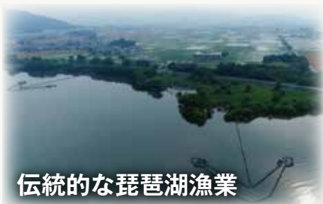
伝統的な琵琶湖漁業