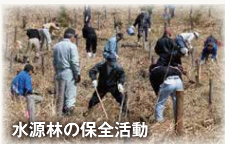
水源林の保全活動