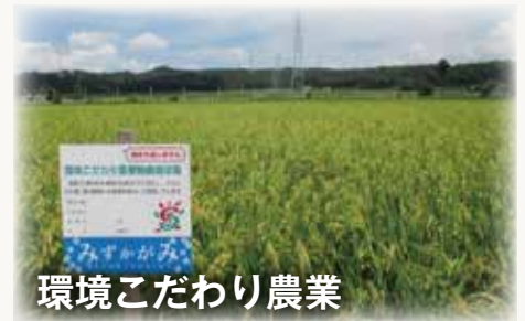
環境こだわり農業