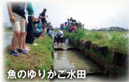
魚のゆりかご水田