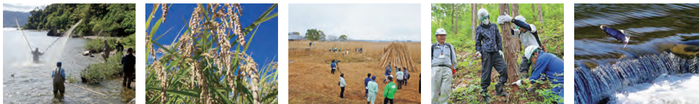
おいさで漁 水質や生態系に配慮した「環境こだわり米」 企業や学生などが参加するヨシ刈り活動 企業の森づくり 河川を遡るビワマス