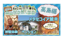
【3分でわかる】 高島エリアの魅力をお届けします！