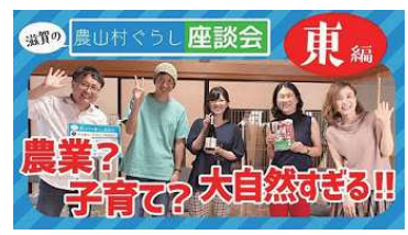
【びわ湖の東編】 滋賀の農山村ぐらし座談会