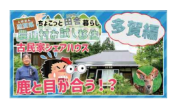
【3分でわかる】 多賀エリアの魅力をお届けします！