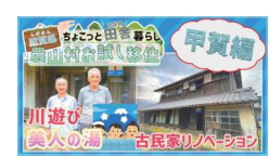
【3分でわかる】 甲賀エリアの魅力をお届けします！