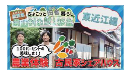
【3分でわかる】 東近江エリアの魅力をお届けします！