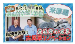
【3分でわかる】 米原エリアの魅力をお届けします！