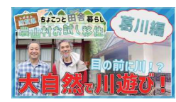
【3分でわかる】 高川エリアの魅力をお届けします！