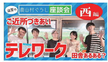
【びわ湖の西編】 滋賀の農山村ぐらし座談会