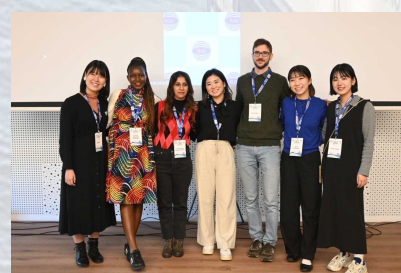
コースセッション