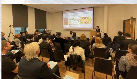
分科会での滋賀県の発表