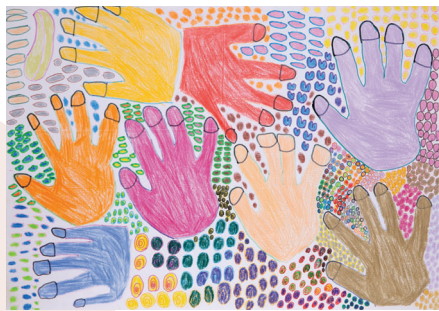
永元 祐樹 てのひら 2022 Yuki Nagamoto <palm> 2022