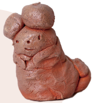
滋賀県立近江学園卒園生 無題 制作年不明 Graduate from Shiga Prefectural Omi Gakuen <untitled> no date