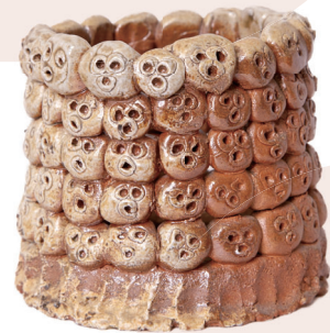
中崎 貴史 無題 2006 Takafumi Nakazaki <untitled> 2006