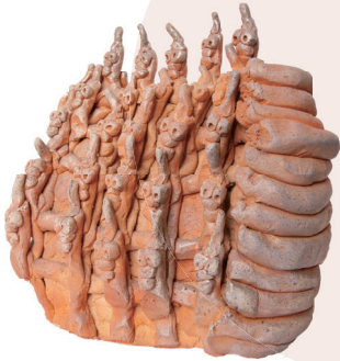
西川 智之 船 1994 Satoshi Nishikawa <ship> 1994