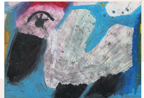
中井 寛虹 つる 2022 Kanji Nakai <crane> 2022