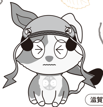
滋賀ご当地キーン「びわんこ」

行政相談では、皆様からの国の行政などへの苦情や意見・要望などについて、担当行政機関とは異なる立場からお話をお聴きし、解決のお手伝いをします。