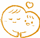
寄り添い型の総合支援