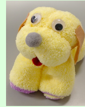
タオルでワンちゃん (イメージ)