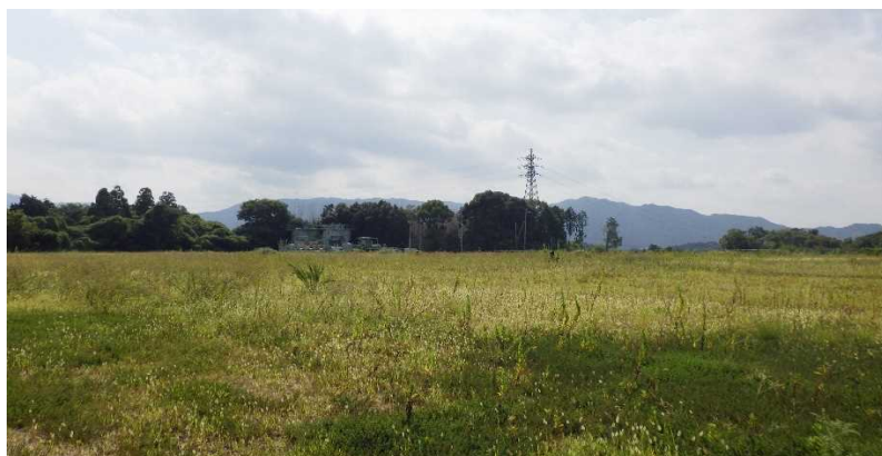
写真① 天端部の様子