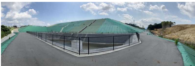
写真② 調整池付近の様子