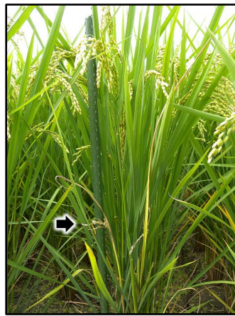
写真2 立毛中のイネ縞葉枯病の発病株 (左) 分けつ期の病徴 (右) 穂の出すくみ