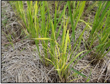
写真1 イネ縞葉枯病が発病した刈り株再生芽