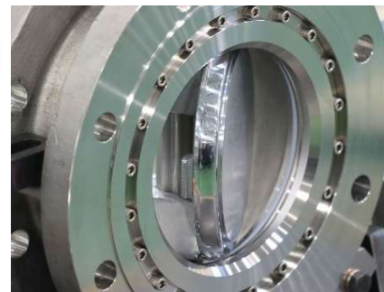
極低温用バタフライバルブ バルブ型式：EFVLN