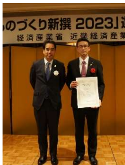
関西ものづくり新撰2023 最優秀賞 受賞