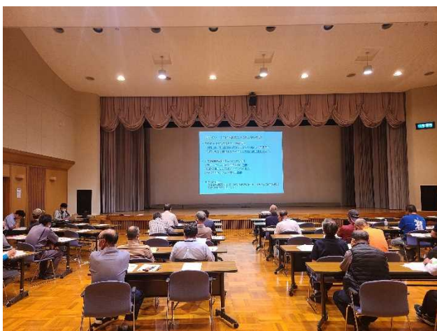
安曇川町での研修

対面での具体例を示した説明により、農作業の危険性や経営に与える影響を実感していただいたと考えています。当課では、引き続き農作業事故の減少を目指して、農業者への啓発に取り組んでいきます。