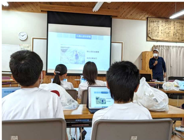
米の栽培方法を説明

当課では今後も引き続き青年農業者クラブに対し、計画立案や日程調整など学校との連携が円滑に行われるよう支援していきます。