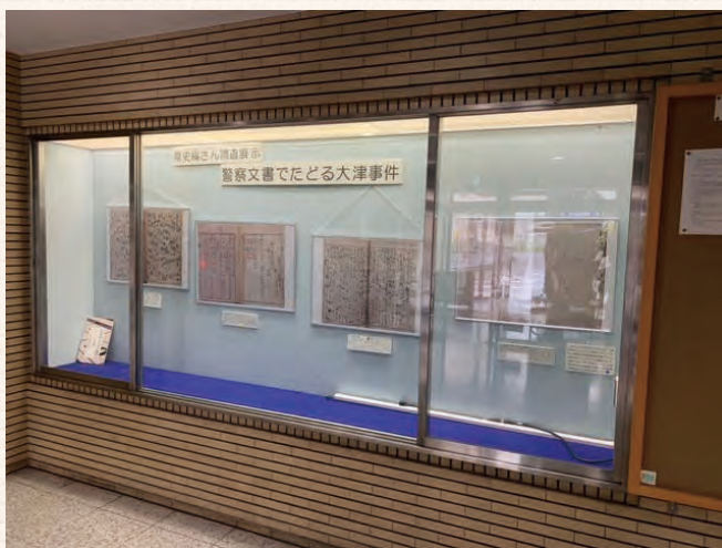
ミニ展示「警察文書でたどる大津事件」の様子

今後もさまざまなかたちで、県民にわかりやすい情報発信に努めますので、ぜひご期待ください。