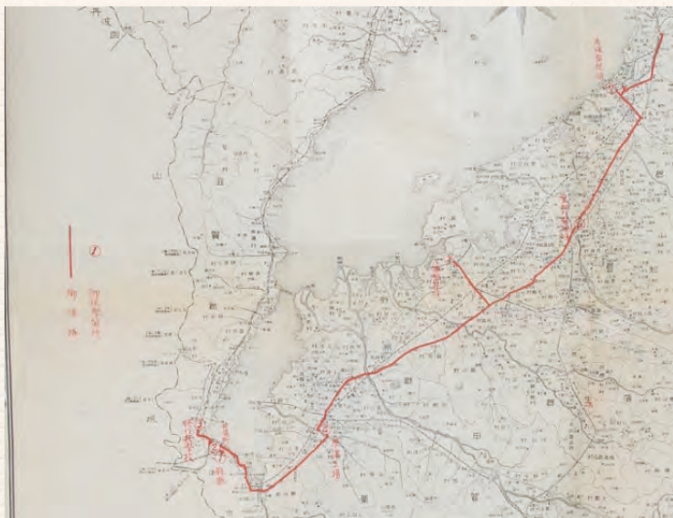
東久邇宮稔彦王殿下御成御り順路略図【昭か33(5)】