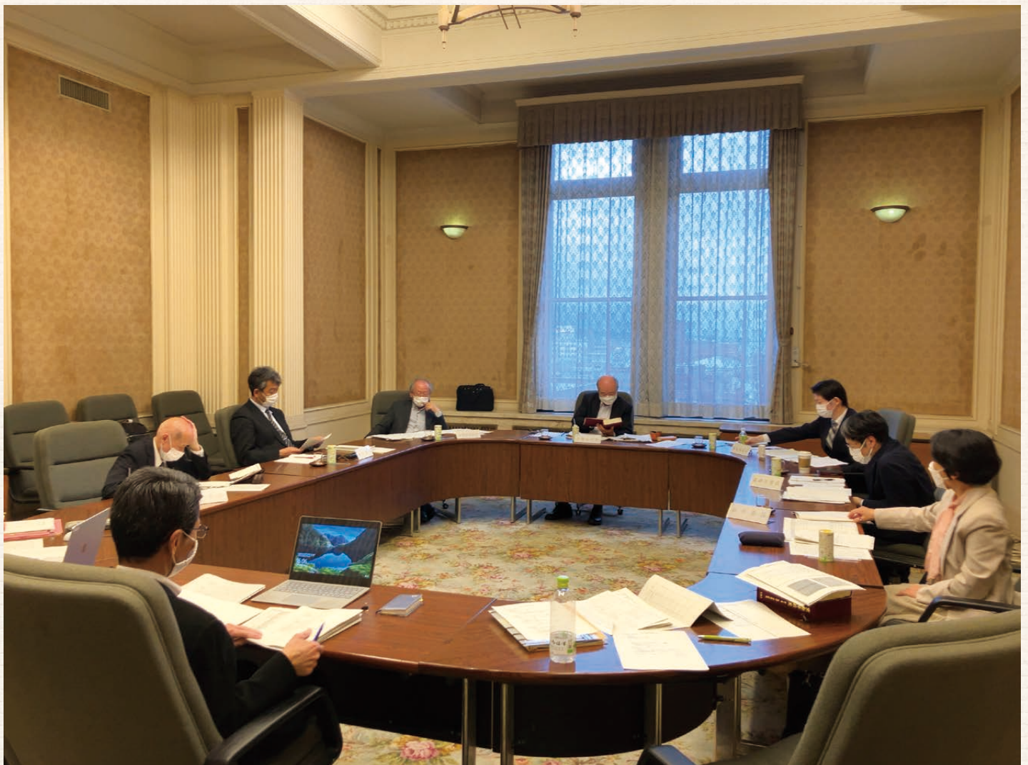
第1回県史編さん編集会議