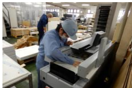
職業体験学習（就業体験）