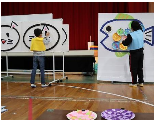
小学部 学習発表会

教育目標に基づいて、“力いっぱい生きる子ども”の育成を目指し、小学部・中学部・高等部の 12年間を見通した系統的な教育課程づくり、安心・安全な学校づくりを進めています。 また、保護者・関係機関・地域社会との密接な連携を図り、個別の教育支援計画・個別の指導計 画を作成し、日々の学習を進めています。