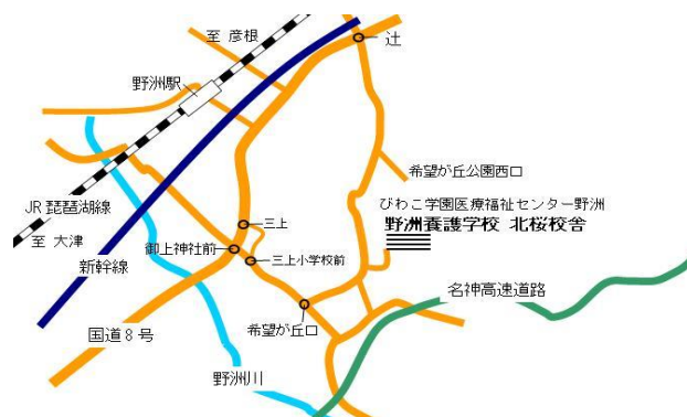
北桜校舎：JR 野洲駅から 6.5km