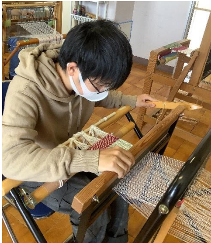
「さをり」の学習の様子

高等部では義務教育の9年間を経て身に付けてきた力を確かなものとし、その力を卒業後の自立と社会参加に向けて伸ばしていく段階にあると捉え、『社会の主権者』として生き抜く力を獲得するために「健康の保持・増進をはかること」「意欲・自信・生きる力を高めること」「いきいきと暮らせる生活づくりを目指すこと」を大切にしています。自分で考え、自分でやろうとする意欲や、自分の力でやりきる経験を重ねることで自信を高め、「いつでも」「どこでも」「だれとでも」発揮していけるような生きる力を育みます。また、仲間と幅広い学習や体験を重ねることを大切に、自信と誇りをもった「社会の主人公」になることを目指します。