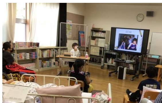
本校：先輩の話を聞く会 『社会人としてご活躍中の先輩を講師に迎えて』