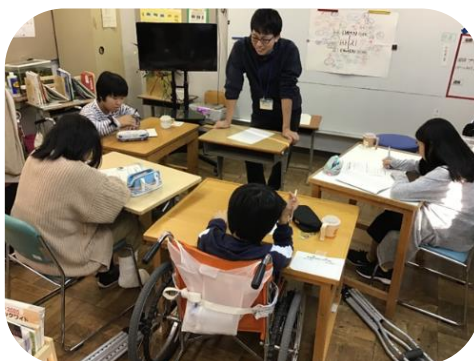
本校：中学部 自立活動 『ストレスについて』