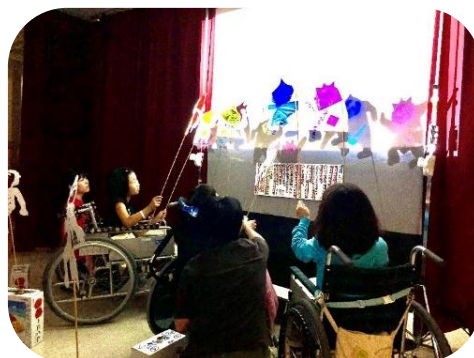
本校：小学部 文化祭 影絵劇『じごくのそうべえ』

対外的には、病弱特別支援学校のセンター的な役割として個別の教育相談のほか、病弱教育に関わる研修会の開催、小学校・中学校の病弱・身体虚弱特別支援学級や小児科病棟を有する病院等への訪問・相談活動などに取り組んでいます。