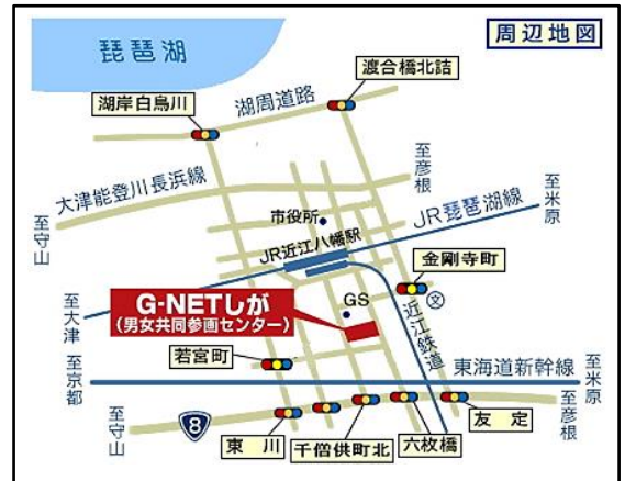
★JR近江八幡駅南口より500m

令和5年11月26日(日)10:00~16:00 しがWO・MANネット登録団体をはじめ、さまざまな団体等が日頃の活動を発表、交流します。広く県民の皆様とともに「男女共同参画」について考えるイベントです。書道パフォーマンスなどの楽しい催しも! 皆様ぜひご参加ください。