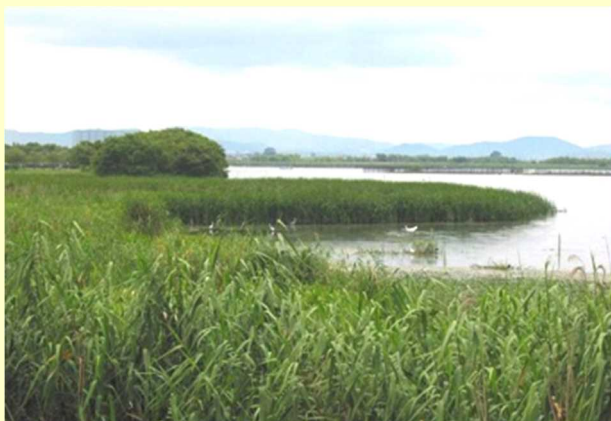
自然湖岸(天然ヨシ群落)

湖岸のヨシ帯のうち、平常時に水に浸かっている「水ヨシ帯」は、ニゴロブナ等の様々な魚類の産卵繁殖、仔稚魚の成育の場として大変重要です。中でも奥行きが30m以上ある「水ヨシ帯」は稚魚の餌になる動物プランクトンが多く発生し、オオクチバスやブルーギルが嫌う低酸素状態となるので、低酸素耐性のあるニゴロブナ稚魚等にとって更に良い成育場であることが判っています。ところが、昭和28年には約260haあった「水ヨシ帯」は、昭和40年代からの開発による湖岸の人工護岸化や内湖の干拓などの影響で、平成15年には約68ha(造成ヨシ帯を除く)と200ha近く減少してしまいました。