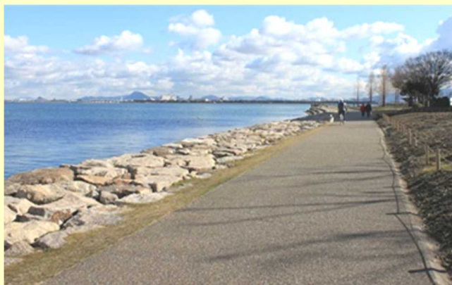
人工的な湖岸形状

一方、セタシジミやヨシ帯で生まれたホンモロコ仔魚等は湖底(沿岸域)の砂地を生息・成長の場としていますが、セタシジミの主な漁場であった南湖では、平成22年まで行われていた建設材料としての砂利採取、河川からの砂の供給量の減少、水草の大量繁茂による湖底の泥化などにより、砂地の面積は昭和44年の719haから平成元年には151haにまで激減し、それに伴いセタシジミの漁獲もほとんど無くなっているのが現状です。