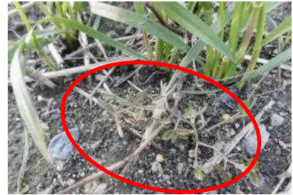
写真1 カラスノエンドウ(2月撮影)