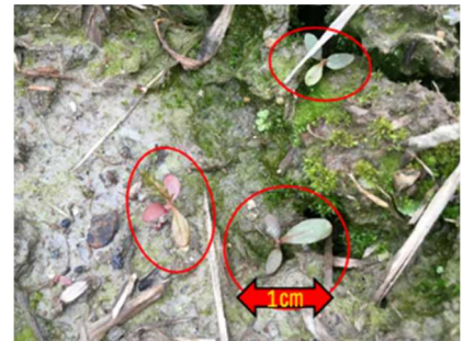
写真3 ハルタデ(1月撮影)