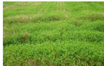
写真4 ハルタデが繁茂した 収穫前の小麦ほ場(5月撮影)