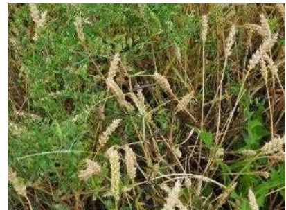
写真2 麦に絡みついたカラスノエンドウ

散布の目安時期は2月末から3月中旬頃で、 生育期（但し、小麦収穫45日前まで、大麦90日前まで） です。