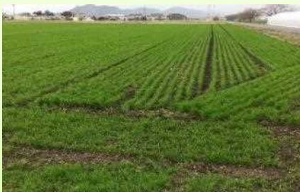
写真(左): 莖立期頃のほ場