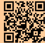
ものづくり体験教室ページ QRコード