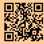
専門学校 HP QRコード

Mail : monodukuri@pref.shiga.lg.jp HP : https://www.pref.shiga.lg.jp/kougi