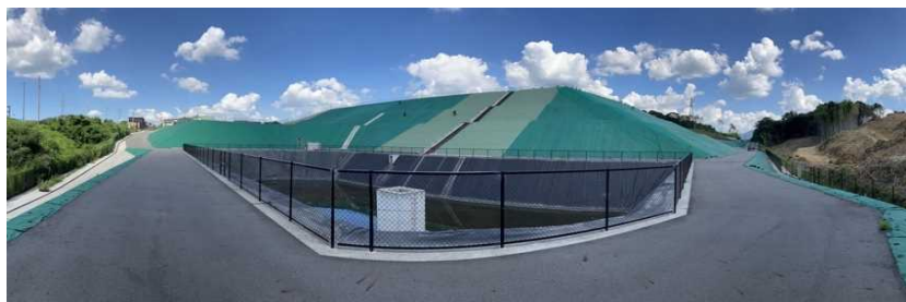
写真② 調整池付近の様子