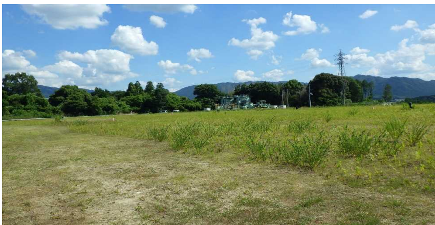
写真① 天端部の様子