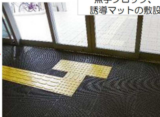
点字ブロック、誘導マットの敷設