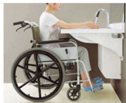
〈対応洗面所への改修工事〉