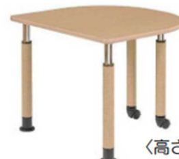
〈高さ可動式テーブル〉