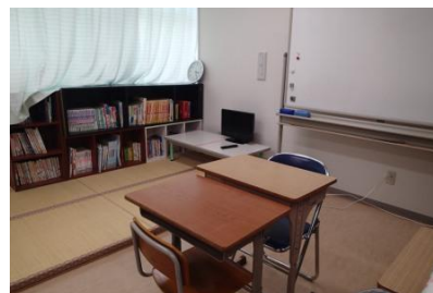
院内学級室内の様子

本学級は、昭和 63 年に高島小学校の病弱・身体虚弱学級として高島市民病院(旧 公立高島総合病院)に開設されました。入級対象は、病院に入院を要し、主治医の学習許可が得られた小学生としていません。けがや病気の状態により、車椅子やストレッチャーでの通級や、ベッドサイド学習などを行うことがあります。