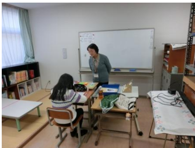
院内学級授業の風景