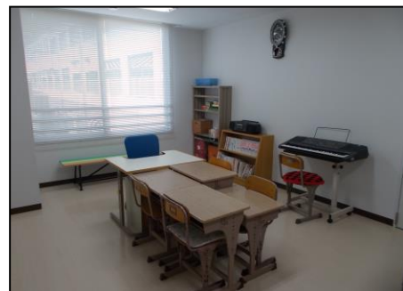
わかば学級教室内

甲賀病院内に入院し、治療・療養しながら教育が受けられる学級です。別表のような日課で、入院児の該当学年にできるだけそったカリキュラムで実施し、あわせて療養生活に必要なことを学ぶための自立活動の時間を設けています。日課もカリキュラムも個々の実態に応じた個別指導をしています。病院や病棟行事、本校や原籍校(入院する前に通っていた学校)の行事や、地域の行事などに、できるかぎり参加しています。