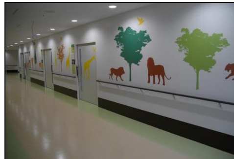
甲賀病院内小児科

城下町として栄えた水口町は、甲賀市の文化や産業の中心地であり、水口小学校は、明治7年開校の伝統を誇る小学校です。わかば学級は滋賀県内でもいち早く昭和52年に、病気療養児のために甲賀病院内に設置された学級です。入院中も、こどもたちが教育を通して自ら輝いて生き生きと成長してほしいと願って学級は運営されています。