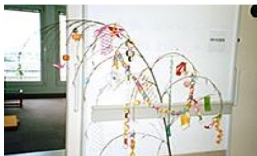
児童や病院職員らでつくった七夕飾り