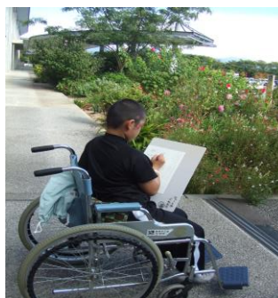
(病院内のスケッチ画作成)