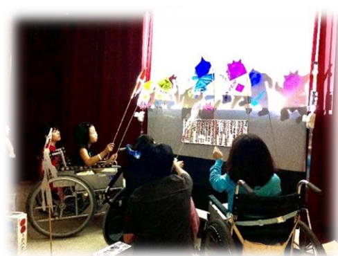
文化祭 小学部影絵劇

文部科学省のGIGAスクール構想に伴うICT環境整備も完了し、病弱特別支援学校における児童生徒の自主的な学習活動にも取り組んでいけるよう、インターネット等通信ネットワークの活用や、タブレット等のICT機器活用研究を推進しています。