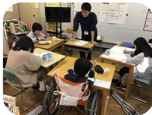
中学部自立活動「ストレスについて」

小学生と中学生と一緒に学んでいる環境を活かして、学部・学年を超えた取組(運動会、文化祭、学習交流会等)を行う中で、自主性、社会性、仲間と協働する力を育むよう努めています。