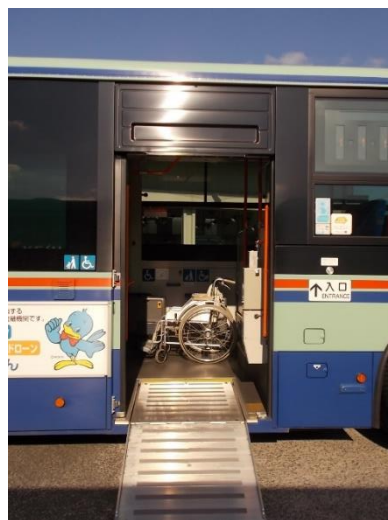
画像6 ノンステップバス