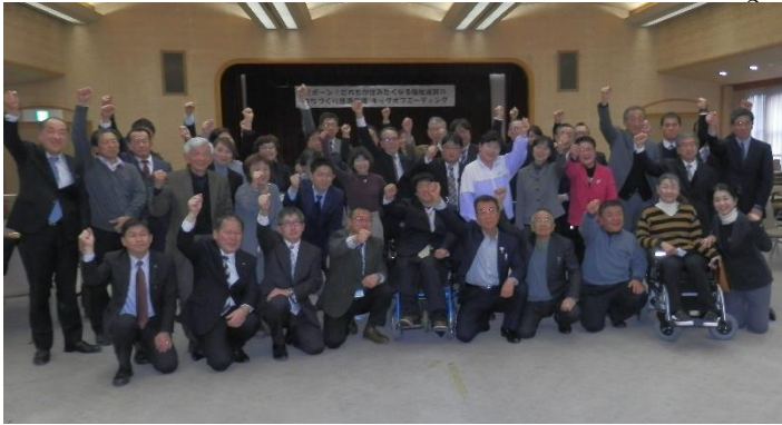
画像1 福祉のまちづくり推進会議