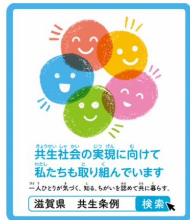
画像4 共生社会サポーターステッカー