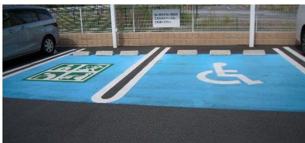
画像5 滋賀県車いす利用者等用駐車場 思いやり区画(左)車いす優先区画(右)