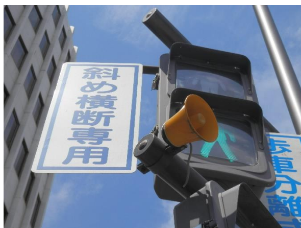
画像7 音響付き信号機