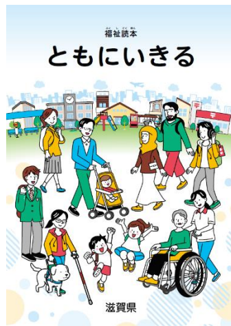
画像3 福祉読本 ともにおきる