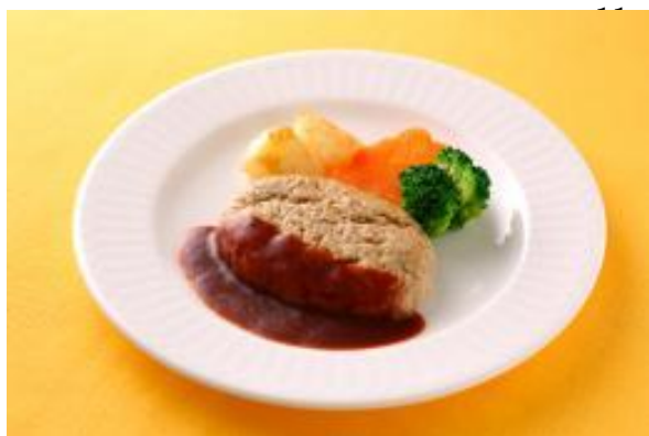
画像9 ユニバーサルデザインフード（日常の食事から介護食まで幅広く食べやすさに配慮した食品のこと。画像は歯ぐきでつぶせるハンバーグ）