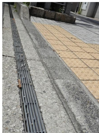
画像8 車道との段差に配慮した歩道