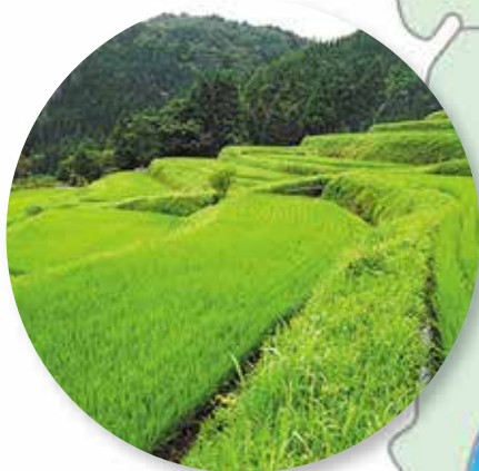
はた 畑の棚田 (高島市)