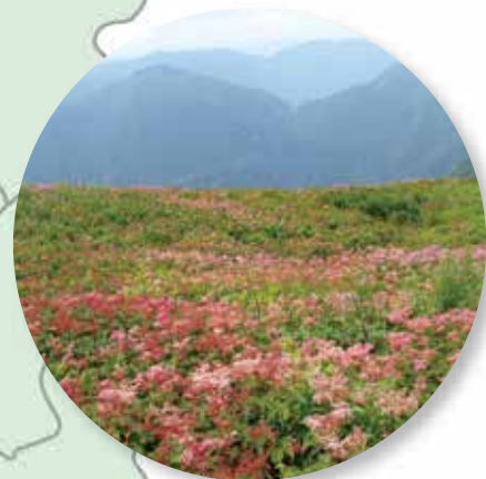
伊吹山のお花畑 (米原市)