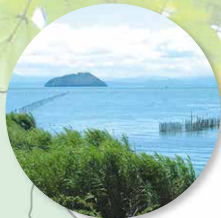
ちくぶ 竹生島とヨシ原 (長浜市)