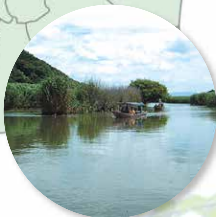
西の湖の水郷めぐり (近江八幡市)