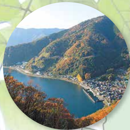
すから 菅浦 (長浜市)