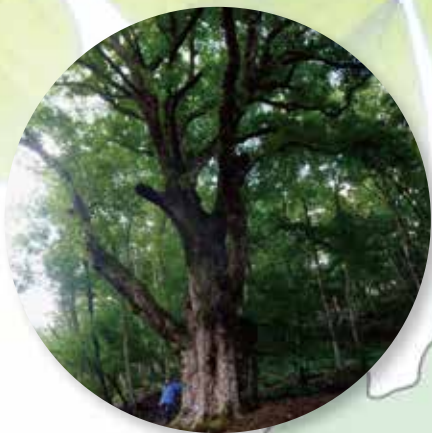
トチノキ巨木 (高島市)