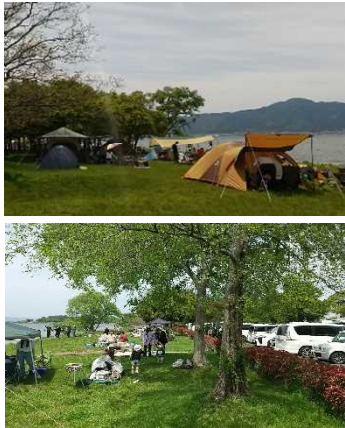
湖岸緑地の利用状況