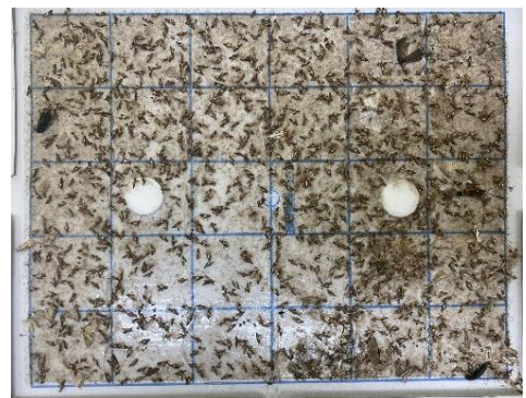
写真 フェロモントラップによる 成虫誘殺の状況 (2023/5/29 撮影)

お問い合わせ先：滋賀県農業技術振興センター茶業指導所 T E L : 0748-62-0276 F A X : 0748-62-7095 Email : GC60@pref.shiga.lg.jp URL : http://www.pref.shiga.lg.jp/nougi-center/about/gaiyou/103375.html