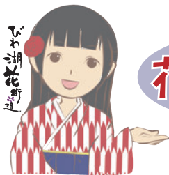
花湖さんは、本講座のネーミング ライツパートナー株式会社国華荘 （おごと温泉「びわ湖花街道」）の イメージキャラクターです。