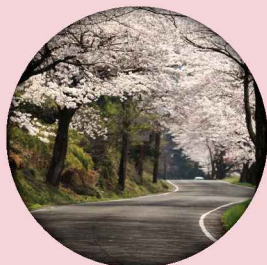
奥琵琶湖パークウェイ