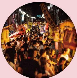
ふるさと夏まつり(木之本地域最大祭日)