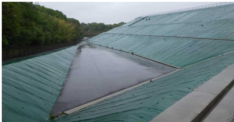
写真① 西市道側の様子