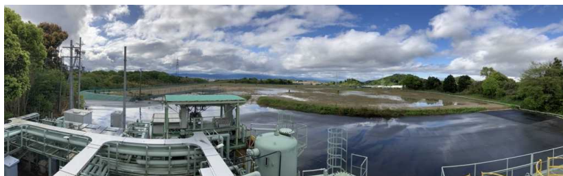
写真② 天端部の様子