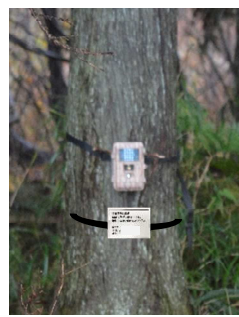
図4：センサーカメラ