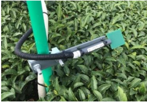
図1 葉濡れセンサー