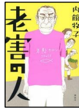
『老害の人』 内館牧子 // 著