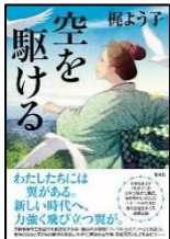
『空を駆ける』 梶よう子 // 著