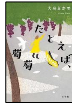
『たとえば、葡萄』 大島真寿美 // 著