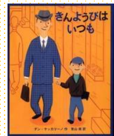
『きんようびはいつも』 ダン・ヤッカリーノ // 作 青山 南 // 訳 ほるぷ出版 2007年

金曜日はいつも、息子のマイケルと近くのダイナーで朝ごはんを一緒に食べています。マイケルが3つになったときから、私たちふたりのとても大事な時間になりました。ふたりとも金曜日を楽しみにするようになりました。皆さんも、私たちのように、小さな行事をつくってみてください、ぜひ。