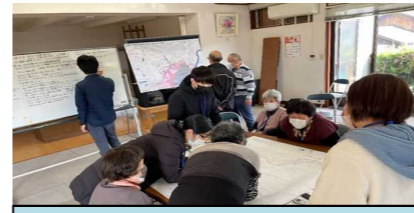
令和3年12月 水害履歴調査