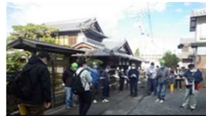
令和2年11月 まちあるき