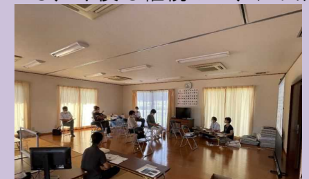
令和4年7月 住民説明会