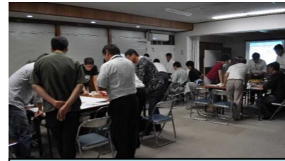
令和元年10月 図上訓練